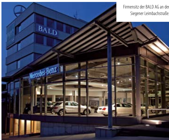
Firmsitz der BALD AG an der Siegener Leimbachstraße.