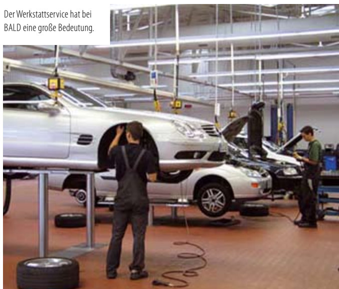
Der Werkstattservice hat bei BALD eine große Bedeutung.

chend Speisen und Getränken wurden Autos zersägt und bei Livebands wurde bis in die Nacht hinein getanzt. Die BALD Mitarbeiter erhielten begeisterte Rückmeldungen zum gelungenen Fest.