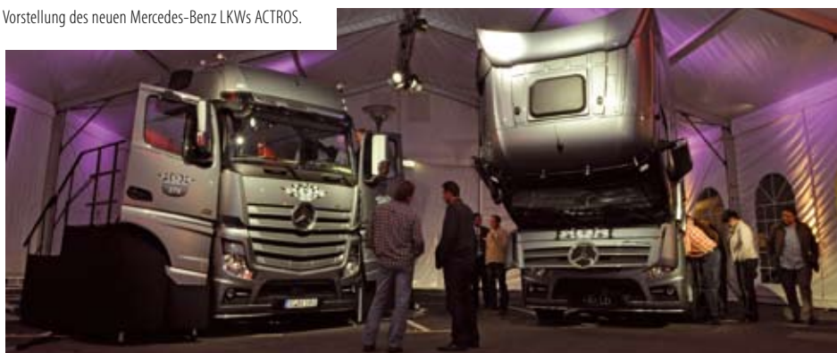
Vorstellung des neuen Mercedes-Benz LKWs ACTROS.