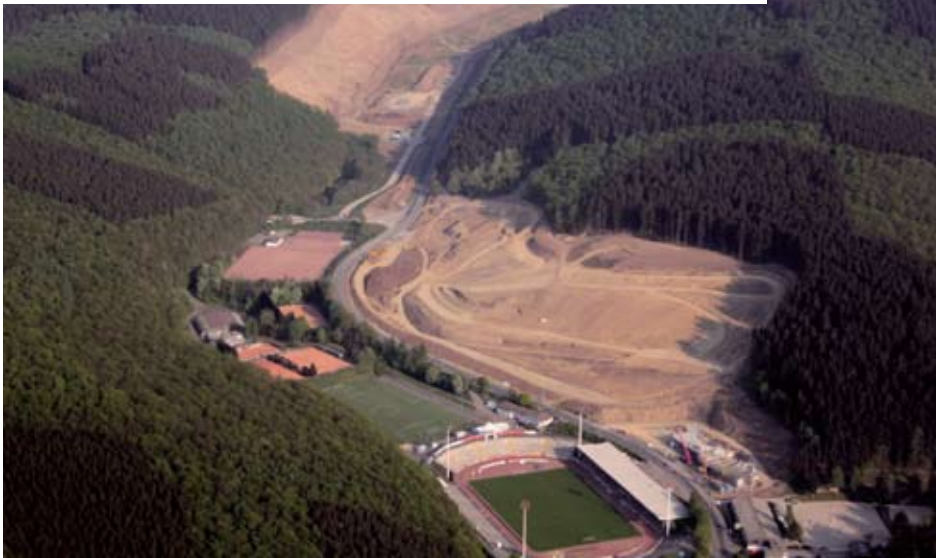
15 Hektar Zukunft an der Autobahn: Dieses Gewerbegebiet an der Autobahnabfahrt Siegen-Süd setzt sich aus den Teilflächen Martinshardt und Leimbachtal zusammen und geht im Sommer an den Start.