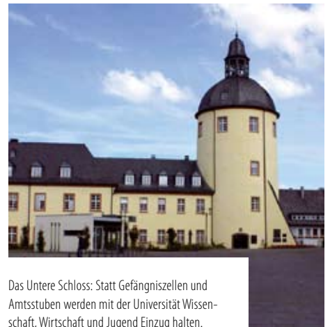
Das Untere Schloss: Statt Gefängniszellen und Amtsstuben werden mit der Universität Wissen-schaft, Wirtschaft und Jugend Einzug halten.