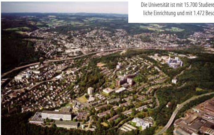
Die Universität ist mit 15.700 Studierende im aktuellen Wintersemester eine staatliche Einrichtung und mit 1.472 Beschäftigten der größte Arbeitgeber der Stadt.

diente seit 1944 als Depot für unersetzliche Kunstschätze aus dem Rheinland, die 1944 per Reichsbahn als „Streng Geheim“ deklariert, nach Siegen transportiert und in den Stollen verbracht wurden. Eingelagert wurden Bilder von Peter Paul Rubens aus dem Bestand des Siegener Museums, die zuvor in einem Stollen in Eiserfeld gelagert wurden, der Aachener Domschatz einschließlich des Schreins mit den Gebeinen Karl des Großen, die Bestände des Suermund Museum Aachen, die Domschätze aus Trier, Bestände aus dem Wallraf-Richartz-Museum und des Schnüthen Museum aus Köln, Bestände aus dem Beethoven-Haus und des Landesmuseums aus Bonn, der Kirchenschatz aus Siegburg, der Münsterschatz aus Essen mit der Goldmadonna. Die Kunstwerke im Hainer Stollen waren nach Kriegsende für die Amerikaner eine Attraktion, knapp zwei Monate betrieb die 8. US Infanterie Division im Stollen ein Kunstmuseum. Anschließend wurden die Kunstwerke wieder an ihre Ursprungsplätze zurück gebracht. Kein Kunstwerk wurde gestohlen, keines beschädigt.