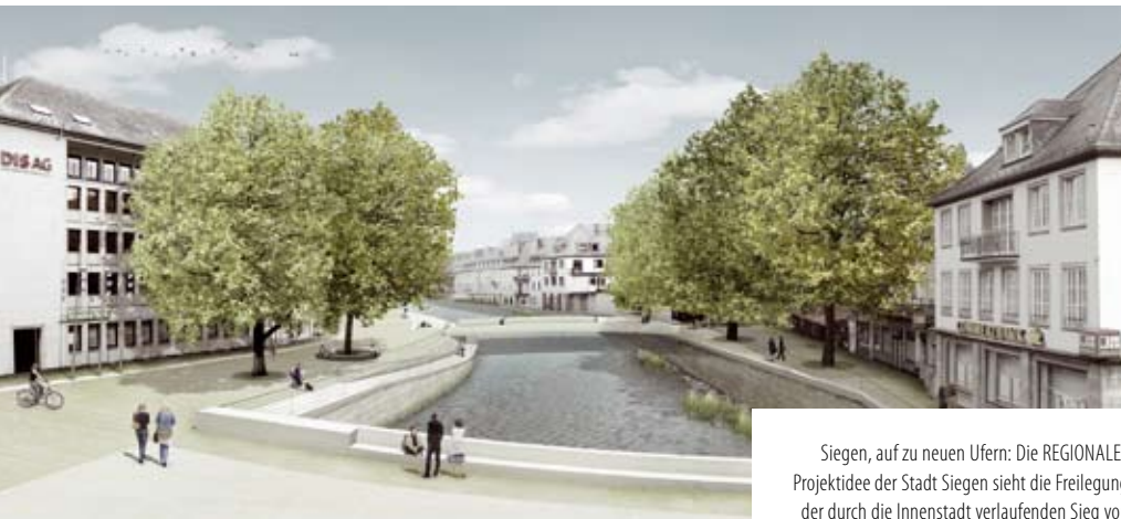
Siegen, auf zu neuen Ufern: Die REGIONALE-Projektidee der Stadt Siegen sieht die Freilegung der durch die Innenstadt verlaufenden Sieg vor.

Weitere Gewerbe- und Industrieflächen zählen zur städtischen Infrastruktur, Restflächen stehen am Bahnhof Ost und in Geisweid bereit. Aktuell werden neue Gebiete erschlossen. So rund 15 Hektar entlang der Autobahn BAB 45. Dieses Gewerbegebiet an der Autobahnabfahrt Siegen-Süd setzt sich aus den Teilflächen Martinshardt und Leimbachtal zusammen. Da in Siegen in der Vergangen- ▶