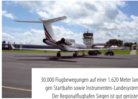
30.000 Flugbewegungen auf einer 1.620 Meter langen Startbahn sowie Instrumenten-Landesystem: Der Regionalflughafen Siegen ist gut gerüstet.

heit keine entsprechenden Flächen angeboten werden konnten, hatten viele Firmen der Stadt den Rücken kehren müssen: Die neuen Flächen sollen bis Juni (Martinshardt) und Oktober (Leimbachtal) baureif für produzierende und verarbeitende Unternehmen, Handwerks- und Dienstleistungsbetriebe zur Verfügung stehen. Einige wenige gewerbliche Immobilien sind aktuell auf dem Markt, Informationen zu den 250 bis 3500 Quadratmeter großen Hallen gibt es bei der Wirtschaftsförderung, die auch Informationen zu modernen Büroflächen bereithält. Ob in der City, im Technologiezentrum oder im Gewerbegebiet Heidenberg stehen moderne Büroflächen zur Verfügung. In Siegen kann man sogar flexible Büros auf Zeit mieten.